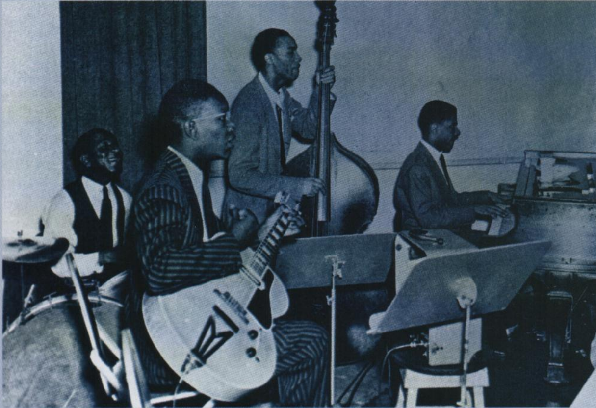
◀ Teddy Wilson au piano. Au premier plan, le guitariste virtuose Charlie Christian.

l'avenir avec sérénité et soif d'aventures, montrant un vif intérêt pour le nouveau langage du jazz de Parker, Gillespie ou Mingus. Enfin, et ce n'est pas la moindre de ses qualités, peu de musiciens ont à ce point réussi à promouvoir le jazz, en Europe et de l'autre côté du rideau de fer où il s'est rendu en 1962 avec Goodman, mais également aux Etats-Unis, où il a animé plusieurs émissions à la radio et dispensé des cours à la célèbre Juilliard School de New York. Teddy Wilson est donc bien l'un des artistes incontournables de la musique de jazz !