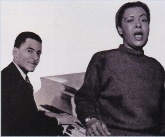
▲ Teddy Wilson et Billie Holiday. Ensemble, ils ont enregistré plusieurs chefs-d'œuvre du jazz classique.