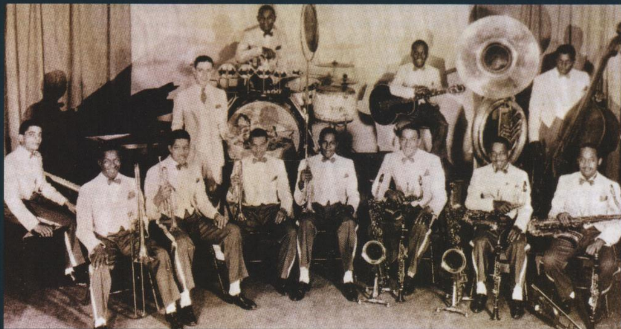
► Le grand orchestre de Teddy Wilson au Famous Door.