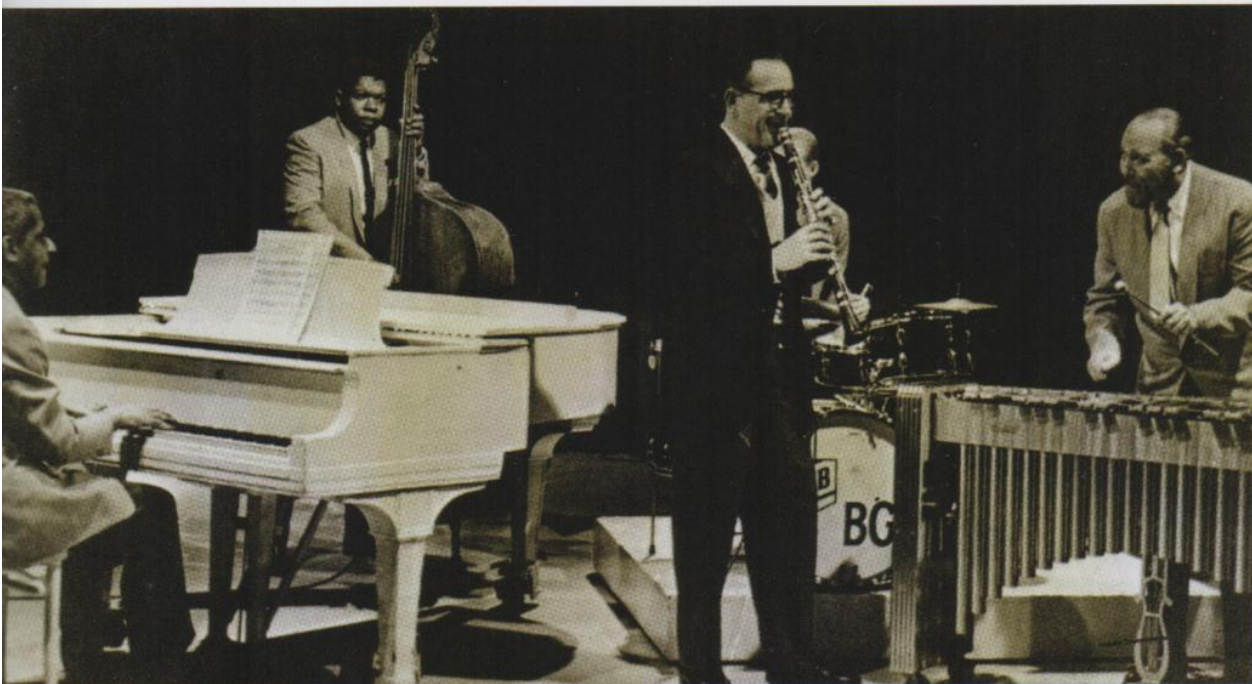
◀ Teddy Wilson et Red Norvo, ici au xylophone, accompagnant Benny Goodman.

C'est le 30 juin 1936 que Why Do I Lie To Myself About You ? a été enregistré, avec notamment le trompettiste Jo Jones, le saxo alto Johnny Hodges et Harry Carney au saxo baryton. Sur un rythme enjoué, typique de l'époque, l'orchestre s'exprime avec liberté mais avec aussi un souci constant de la discipline. L'entente entre le pianiste et les solistes est tout à fait remarquable.