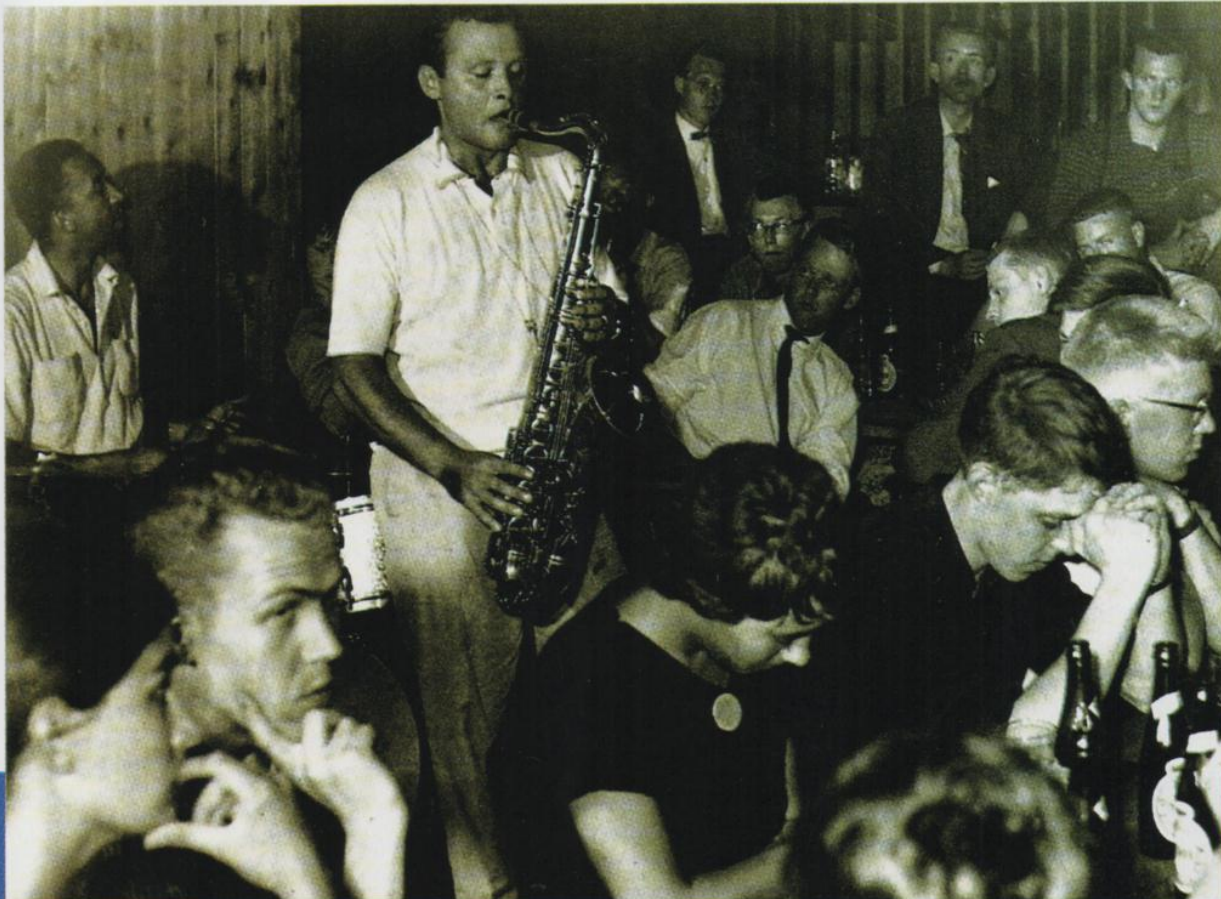
◀ Stan Getz à la conquête du public danois dans les années 50.

Encore un standard que Stan Getz aura marqué de sa griffe. Le saxophoniste montre ici qu'il n'excelle pas seulement dans les ballades, mais qu'il est aussi à l'aise sur les tempos plus soutenus. A 25 ans, son style avait déjà atteint la pleine maturité.