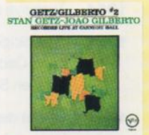
◀ Après Getz, Coleman Hawkins se laissera séduire par les rythmes sensuels du Brésil.

Élément à part entière du jazz pour les uns, musique commerciale pour les autres, la bossa-nova aura vécu son âge d'or au cours des années 60. Les Etats-Unis mais aussi l'Europe y succomberont. Mécontents d'avoir été, en quelque sorte, « récupérés », les créateurs du genre reviendront par la suite à des racines musicales sans doute plus authentiques.