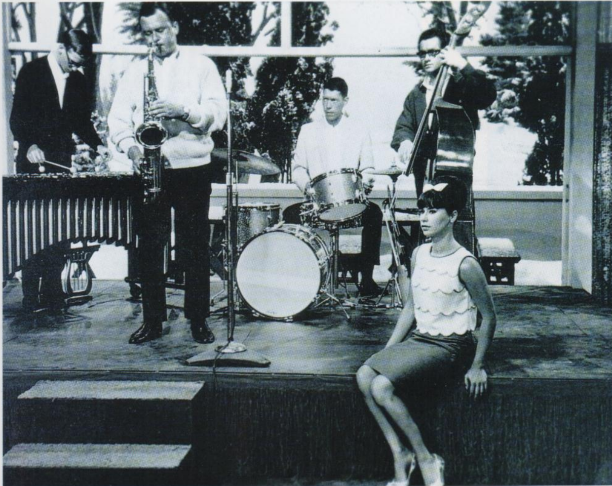
◀ Stan Getz et son orchestre avec la chanteuse Astrud Gilberto.

La bossa-nova s'affirmera comme le courant majeur de la musique populaire brésilienne de l'après-guerre. Grâce surtout à Stan Getz, l'engouement pour la bossa sera immense durant les années 60, aux Etats-Unis et en Europe.