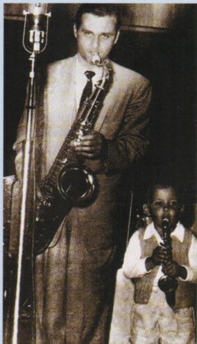
► Le saxophoniste en 1953. Il a déjà transmis le virus du jazz à son fils.

sensation, assez en tout cas pour que Woody Herman leur propose de venir jouer dans son orchestre, The Second Herd. « Idéal sonore du cool jazz »,