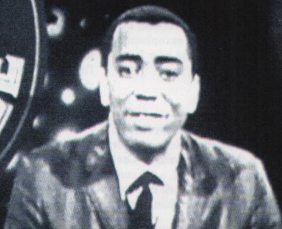
► Le chanteur Oscar Brown Jr. au Shelly's Manne Hole.

L e boom économique dont bénéficia la Californie avec l'entrée en guerre des Etats-Unis en 1941 eut d'heureuses conséquences sur les activités musicales de Los Angeles. Les clubs qui s'y créèrent, en général dans le quartier noir (Central Avenue), attirèrent de nombreux musiciens de jazz tout au long de cette période.