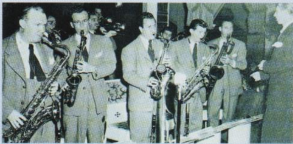
▲ L'orchestre de Stan Kenton se révélera un précieux tremplin pour beaucoup de musiciens du jazz West Coast .