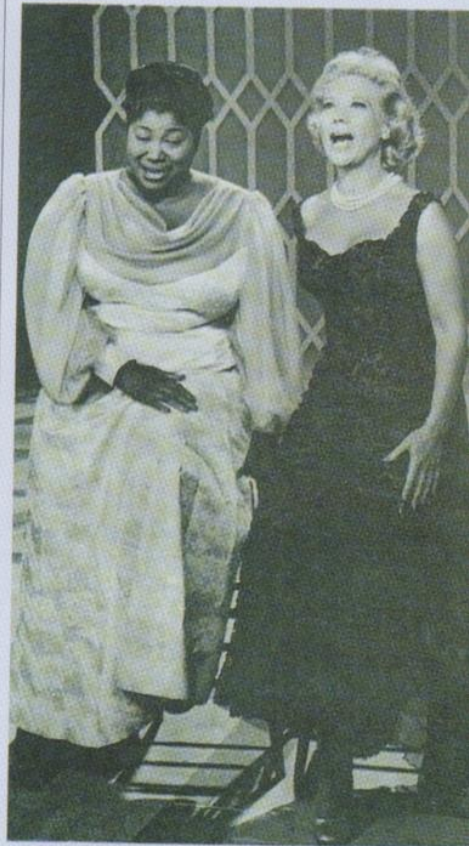
▶ Mahalia Jackson en compagnie de la chanteuse Dinah Shore.

En l'espace de quelques semaines, Mahalia Jackson accède au statut de star et elle ne quittera plus le firmament. Consacrée « soliste officielle » de la convention annuelle des Eglises baptistes, elle ne peut honorer toutes les invitations qui lui sont faites. Sa réputation déborde très vite le cadre de l'Amérique noire, puis de l'Amérique tout