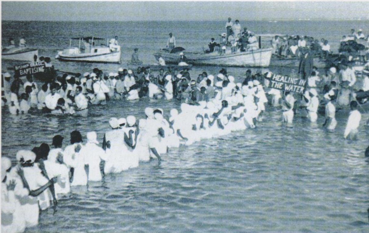
◀ Un baptême collectif dans le Sud, au sein de la communauté baptiste.

L'histoire du peuple noir américain est intimement mêlée à celle du christianisme dans le Nouveau Monde. Au sein de congrégations qui leur sont propres, les Noirs ont su créer une pratique musicale emblématique.