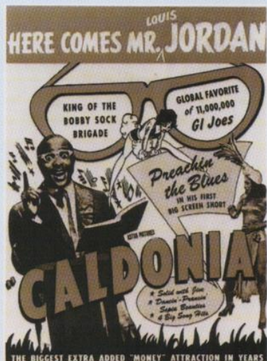
► « Caldonia », l'un des plus grands succès du musicien-acteur.