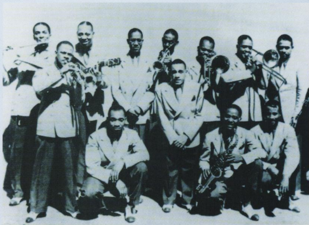
▲ Le grand orchestre de Chick Webb. On reconnaît le leader, au centre, et Louis Jordan, agenouillé, à droite.