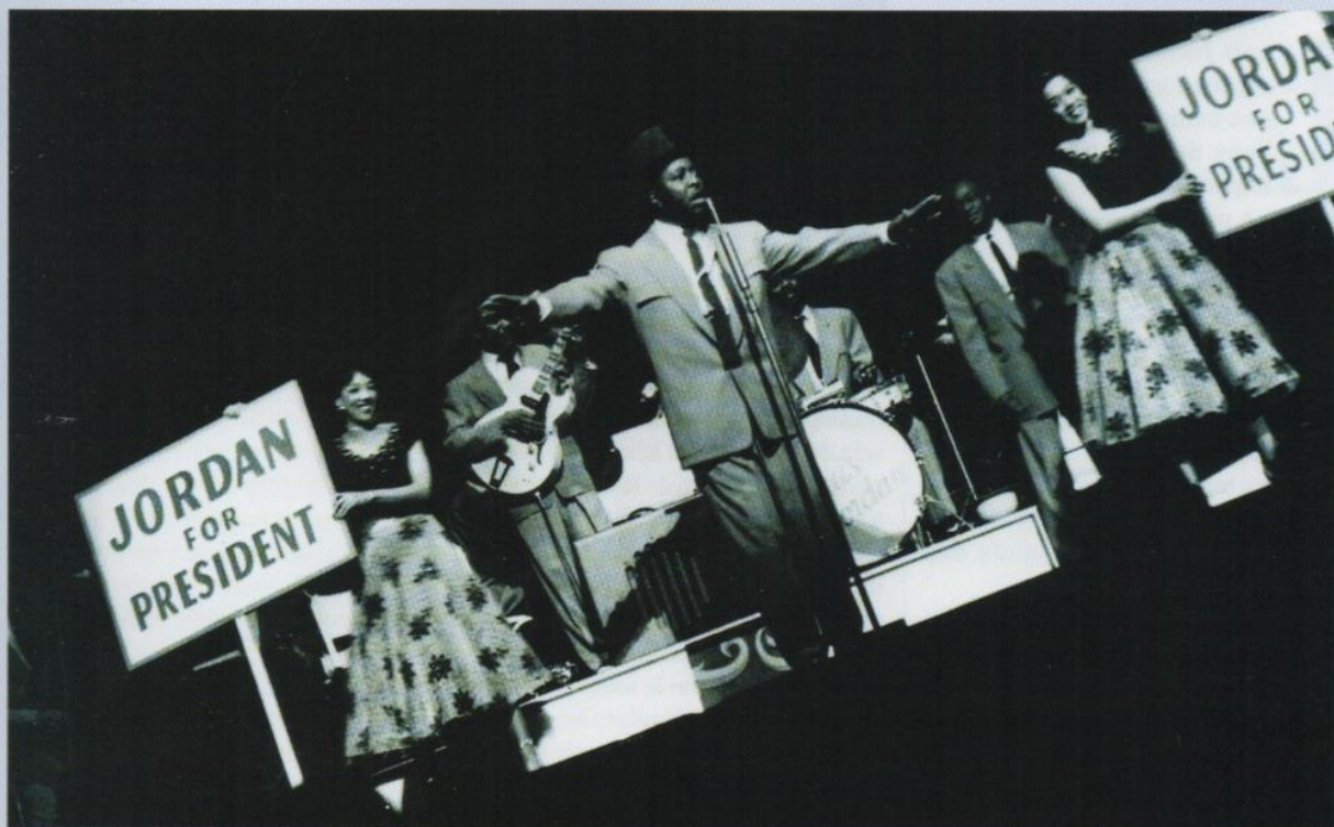
◀ Louis Jordan président ! L'humour et la dérision se retrouvent dans la musique et les shows du chef d'orchestre.