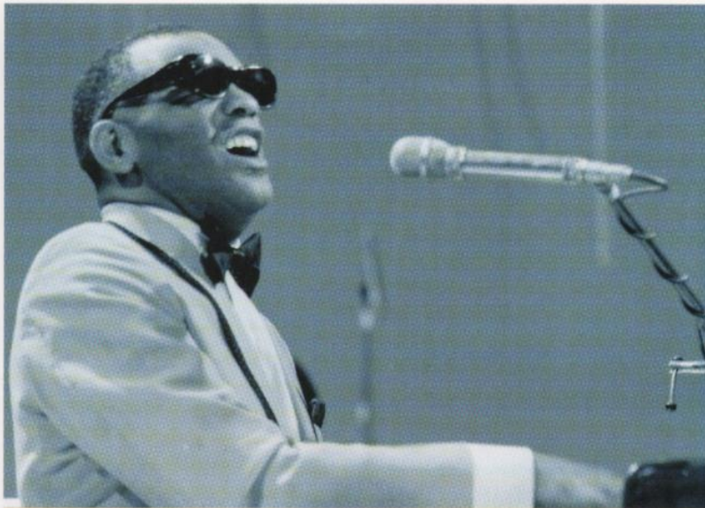
◀ Ray Charles, enfant spirituel de Jordan.

AFFINITÉ Les musiciens qui se réclament de l'influence de Jordan pourraient figurer dans un « Who's Who » du rhythm'n'blues. On y trouve aussi bien Chuck Berry, Fats Domino, Ray Charles et Bo Diddley que Freddy King, Little Milton et Screamin' Jay Hawkins. Quant à B.B. King, il n'a jamais caché son admiration inconditionnelle pour le saxophoniste en incorporant à son répertoire ses plus grands standards, de Let The Good Time Roll à Caldonia , en passant par How Blue Can You Get .