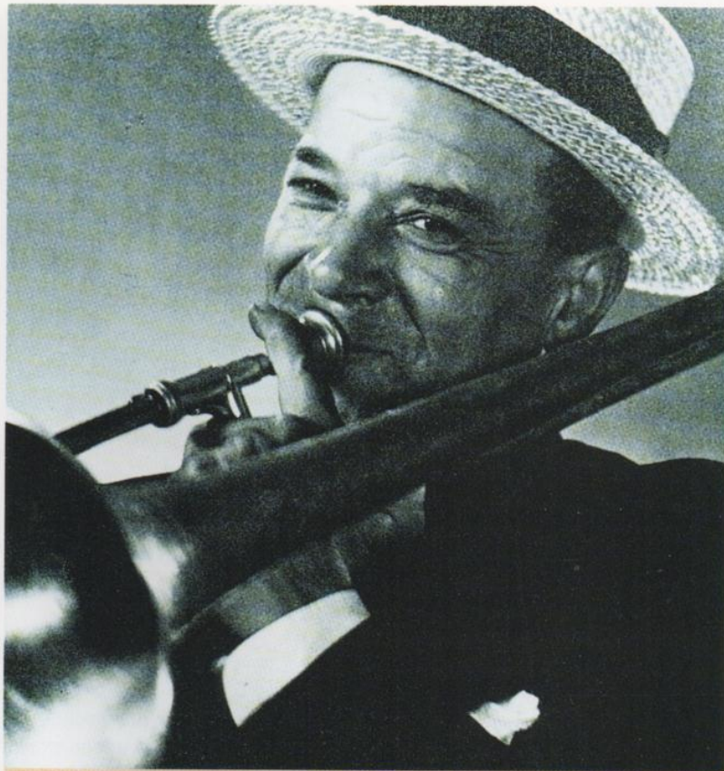
◀ Kid Ory, le tromboniste le plus célèbre de Crescent City.

A défaut d'avoir possédé cette virtuosité magique d'Armstrong, Oliver n'en a pas moins été un brillant cornettiste, utilisant les « blue notes ». De son jeu, Alain Gerber écrit qu'il est « dépouillé, robuste, simple et vigoureux [et] confortablement assis sur le temps ; le vibrato est serré, un peu comme celui de Sidney Bechet sur la clarinette, et la sonorité chaude plutôt que chaleureuse (...) ».