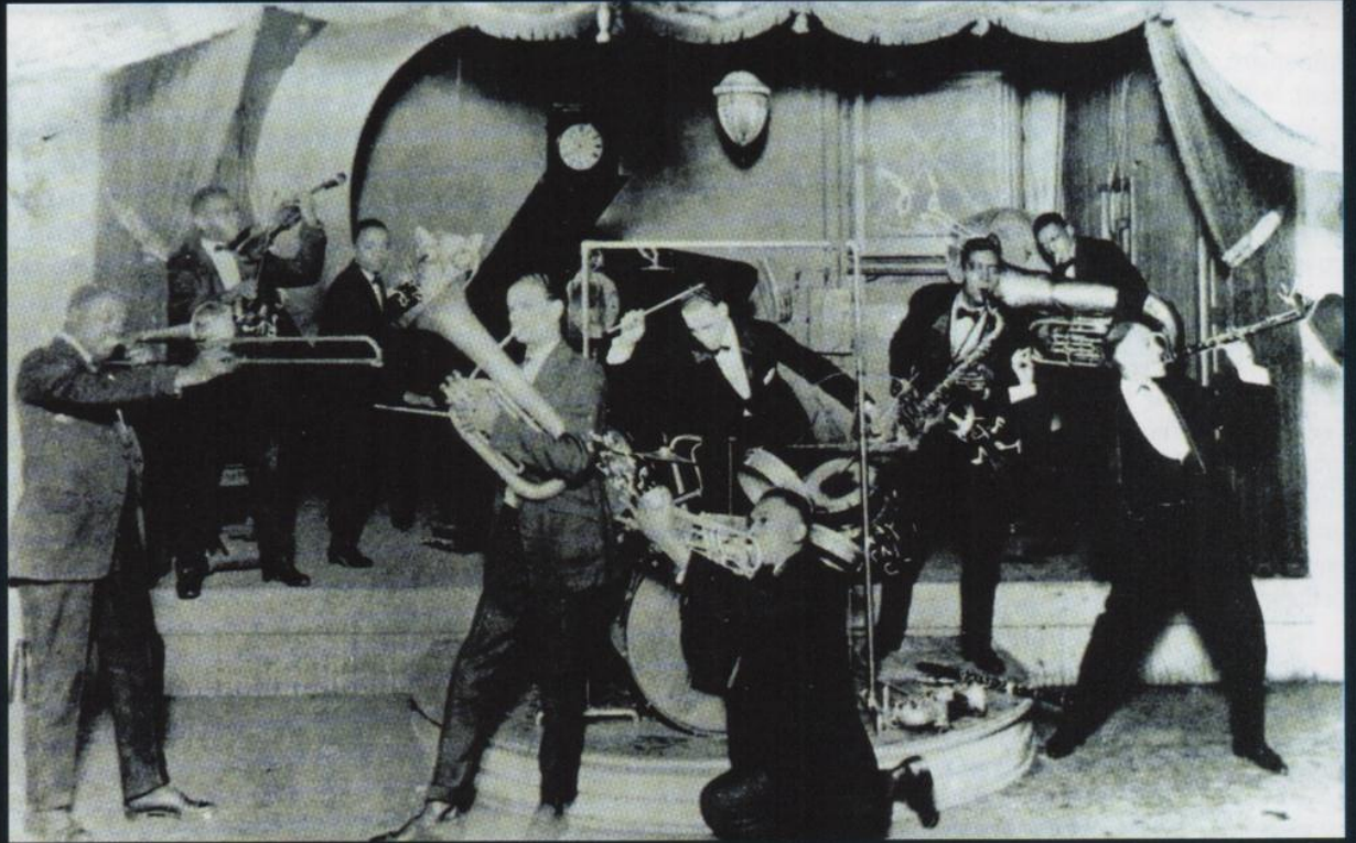
► La scène du Lincoln Gardens, le club de jazz le plus célèbre de Chicago durant les « Roaring Twenties ».

Situé sur la 31 e Rue, dans le quartier noir de Chicago (le South Side), le Lincoln Gardens, d'abord baptisé le Royal Gardens, fut le club de jazz le plus célèbre de la ville durant la prohibition. Bien qu'il fût réservé à la clientèle noire, certains musiciens de race blanche y eurent accès et purent ainsi se familiariser avec les rythmes hot des musiciens néo-orléanais.