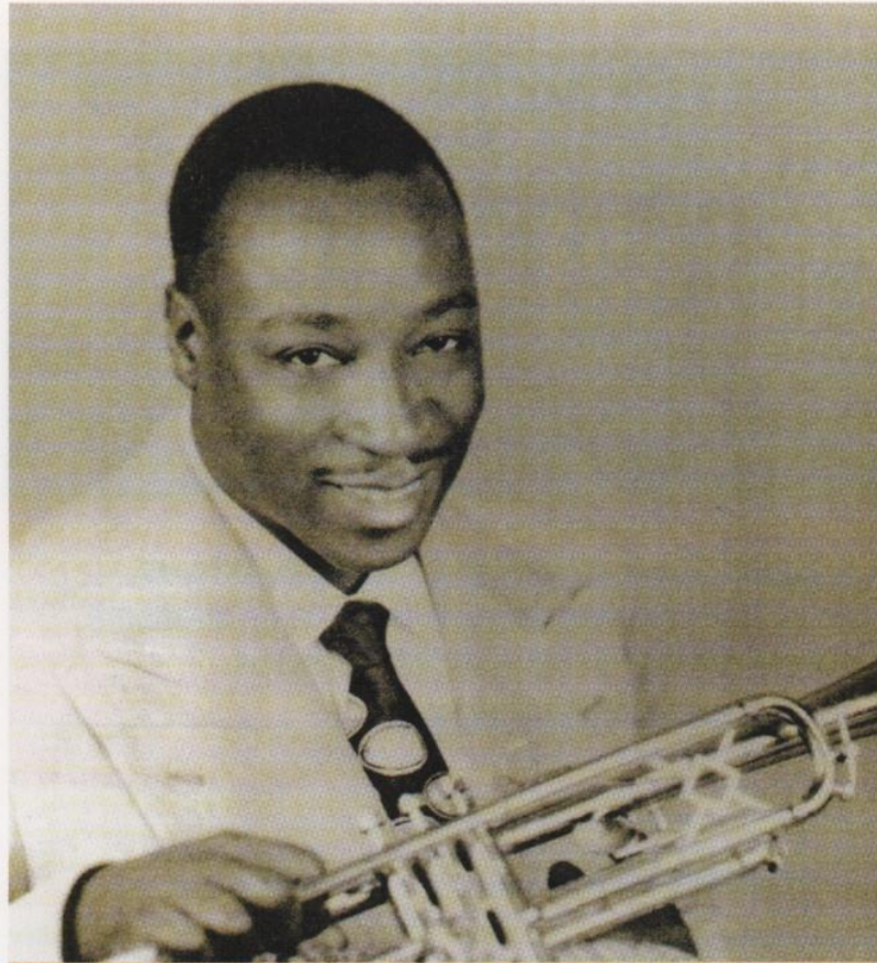
◀ Dave Bartholomew : venu du jazz, le trompettiste se révélera un précieux conseiller pour Fats Domino.

Certains puristes lui ont fait le reproche d'avoir ainsi vendu son âme au pouvoir économique blanc. À l'écoute de Lady Madonna , curieuse reprise des Beatles, ou encore de pièces médiocres comme Dance With Mr. Domino , gravée au plus fort de la mode du twist, ces critiques ne semblent pas injustifiées, mais elles ne doivent pas occulter les apports considérables de Domino à la musique populaire de son temps.