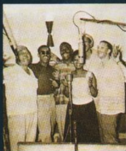
▲ L'orchestre régulier du prestigieux studio néo-orléanais.

► Fats Domino et Dave Bartholomew en pleine séance de travail dans le studio de Cosimo Matassa à La Nouvelle-Orléans.