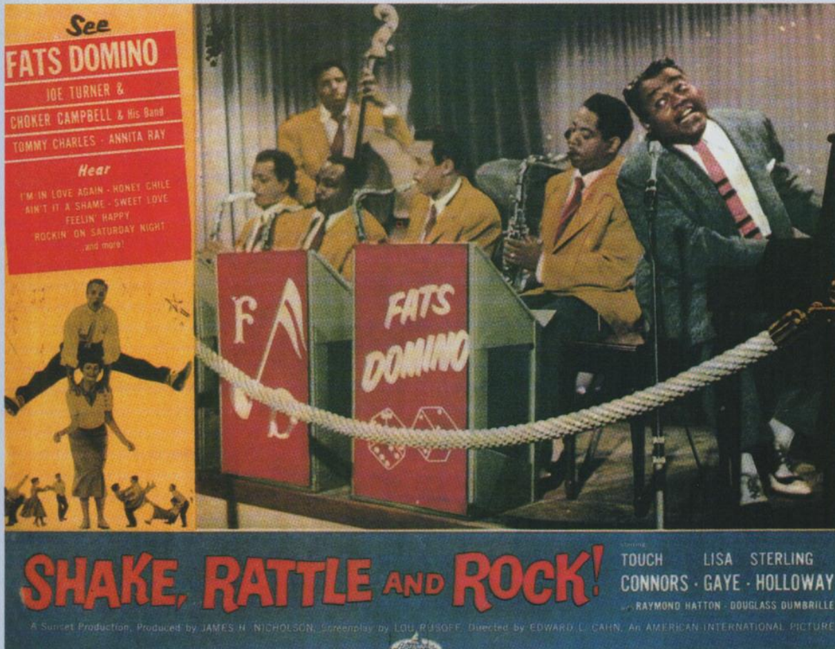
◀ Fats Domino crève l'écran dans le film très rock'n'roll «Shake, Rattle And Rock».

Fats Domino raccompagne son « ami français » à la grille, non sans lui avoir offert en guise d'adieu un mini-concert d'une dizaine de minutes.