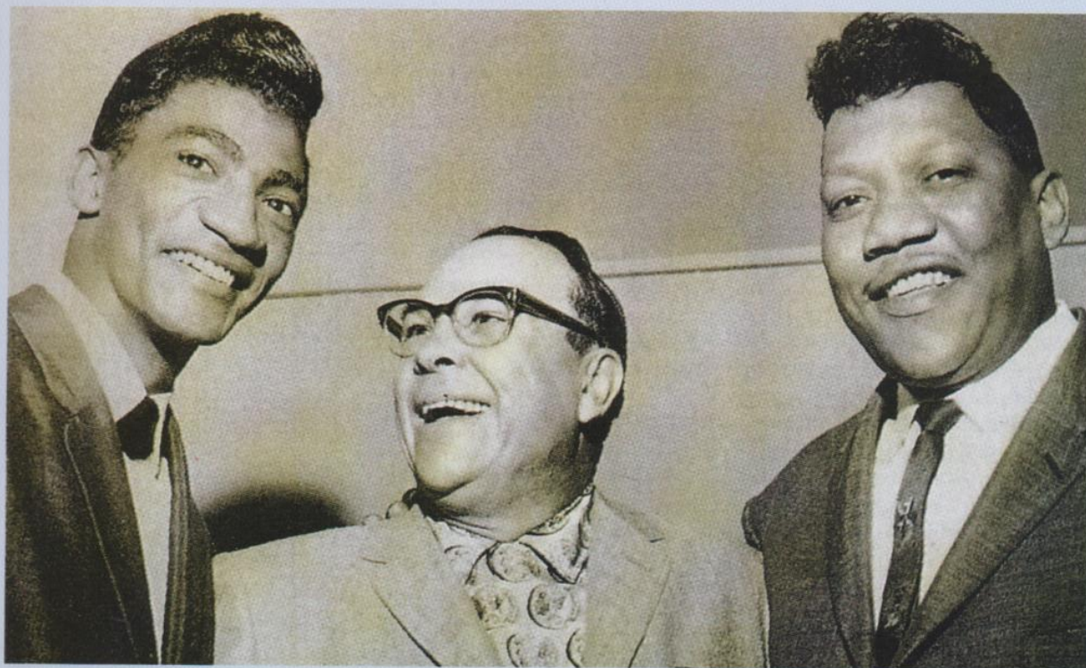
◀ Bobby Blue Bland (à droite) avec son producteur Don Robey (au centre) et le chanteur TNT Bragg, qui a longtemps « chauffé » le public pour le « crooner » de la musique afro-américaine.

lorsque les champs sont déserts, les enfants vont à l'école, mais Bobby ne dépassera pas les petites classes.