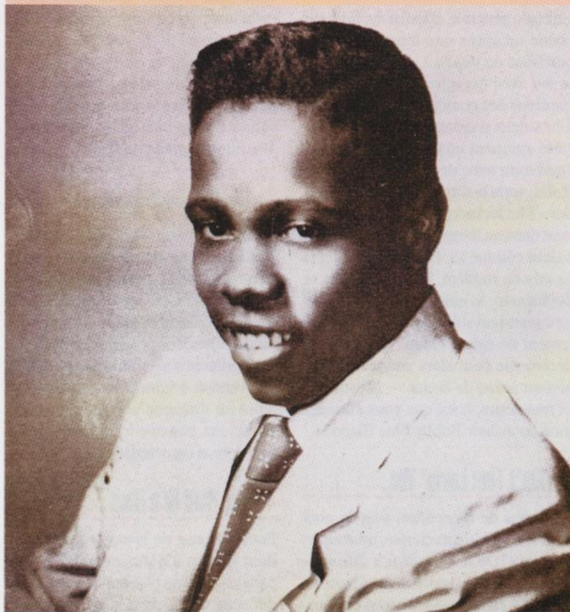
◀ Johnny Ace, la plus grande star des Beale Streeters.

L'émotion est considérable dans la communauté afro-américaine. Elle fera des funérailles grandioses au chanteur de charme, et lui offrira même un immense succès posthume avec Pledging My Love , sorti à la hâte par Duke, et devenu depuis un grand classique de la ballade.