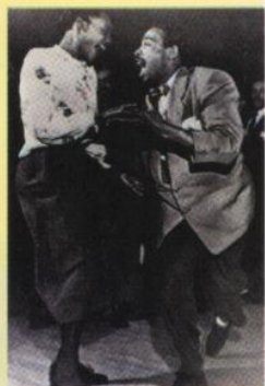
▲ Les danseurs, nouveaux héros des années 30.