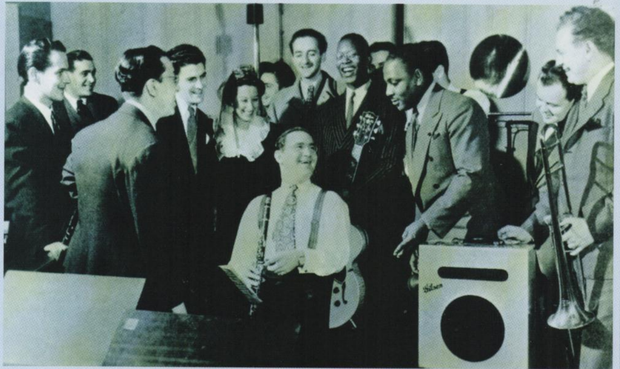
► Benny Goodman, chef d'orchestre. On reconnaît, juste derrière lui, le guitariste Charlie Christian.