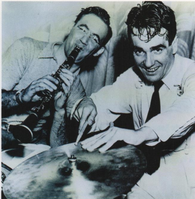
◀ Goodman et Krupa. Deux créateurs parmi les plus populaires de la « swing craze ».