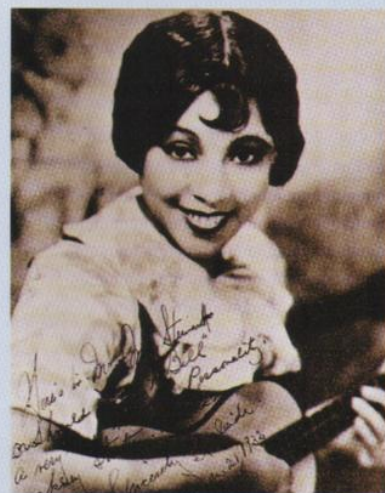
► Adelaide Hall : c'est grâce à la chanteuse que le pianiste gagne New York en 1932.

Que ce soit au Ciro's et au Paradise de Londres, à l' Onyx Club et au Chicken Shack de New York, au Three Deuces de Chicago ou au Alabam Club de Hollywood, c'est le triomphe. Partout on applaudit cet alchimiste du clavier, capable de transformer en chef-d'œuvre