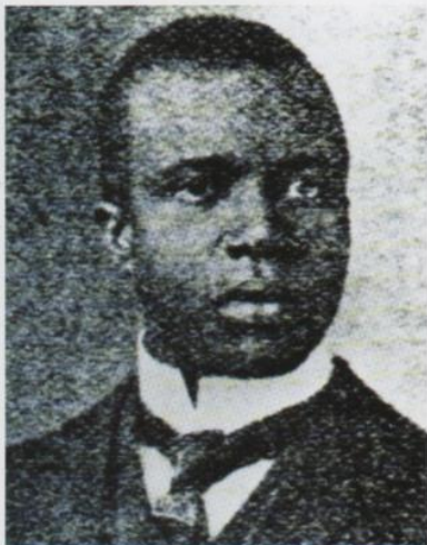
▼ Fats Waller transcenda le piano stride et conquiert Broadway.

Willie The Lion Smith, Fats Waller, Earl Hines, Duke Ellington et Art Tatum ont rendu hommage à ce style de piano jazz qui, tout en étant fondé sur la virtuosité, n'en reste pas moins chaleureux. Un style qui jouera un rôle déterminant quant à l'évolution de la musique afro-américaine.