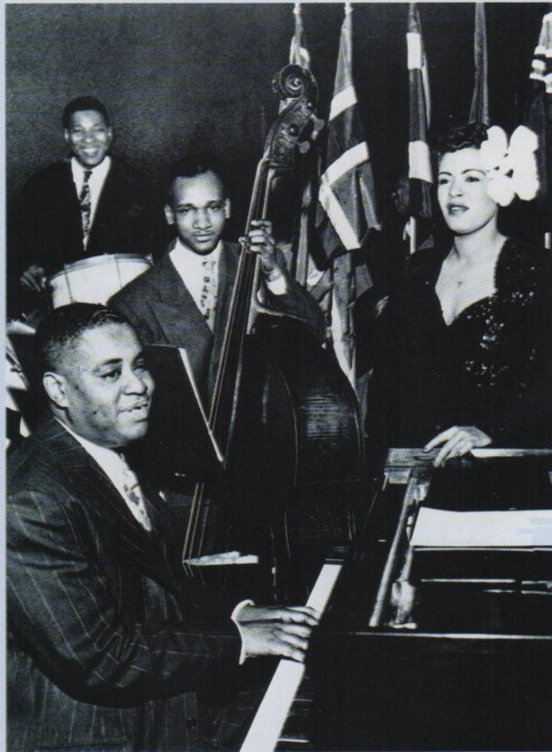
◀ Art Tatum, accompagnateur de Billie Holiday. Oscar Pettiford est à la contrebasse et Big Sid Catlett à la batterie.

Né à Toledo (Ohio) le 13 octobre 1909, Arthur Tatum souffre dès son plus jeune âge d'une cataracte qui le rendra quasiment aveugle. Il confiera plus tard qu'il distinguait péniblement les couleurs, les formes à courte distance