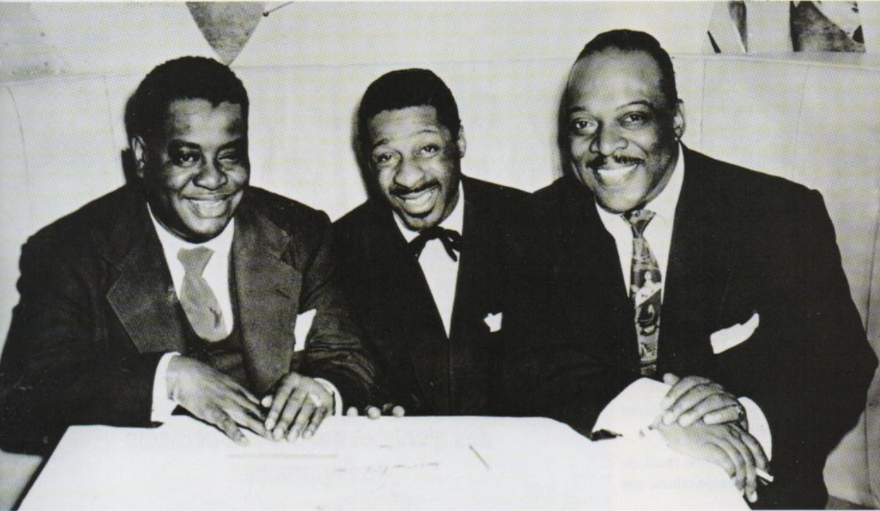
◀ Art Tatum, Erroll Garner et Count Basie ont représenté trois écoles du piano jazz.

Le piano jazz est né des rythmes endiablés que l'on entendait dans les bars au début du siècle. En cela, des pianistes comme Art Tatum, Fats Waller ou Count Basie sont les fils spirituels de Scott Joplin et James P. Johnson.