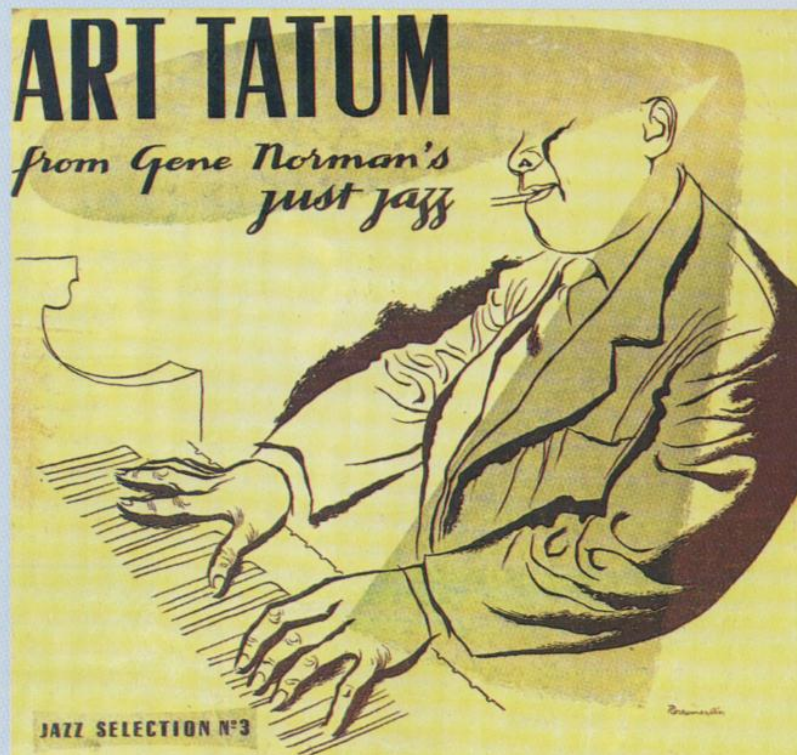
► Pochette d'un disque enregistré par Art Tatum à Toronto.

suivantes, Art Tatum partage son temps entre ses prestations à la radio et celles dans les cabarets du Midwest.